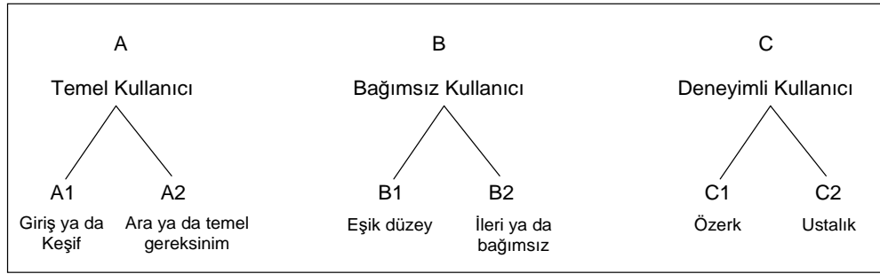
OBM Ölçütlendirilmiş Düzeyler

Yukarıda bahsi geçen iki temel yaklaşıma ek olarak programda, basitten karmaşığa, yakından uzağa, somuttan soyuta olmak üzere dinleme-anlama, konuşma, okuma-anlama ve yazma becerilerine odaklanılmış, öğrenci merkezli olması hedeflenmiş ve Diller İçin Avrupa Ortak Başvuru Metni’nden (OBM) yararlanılmıştır.