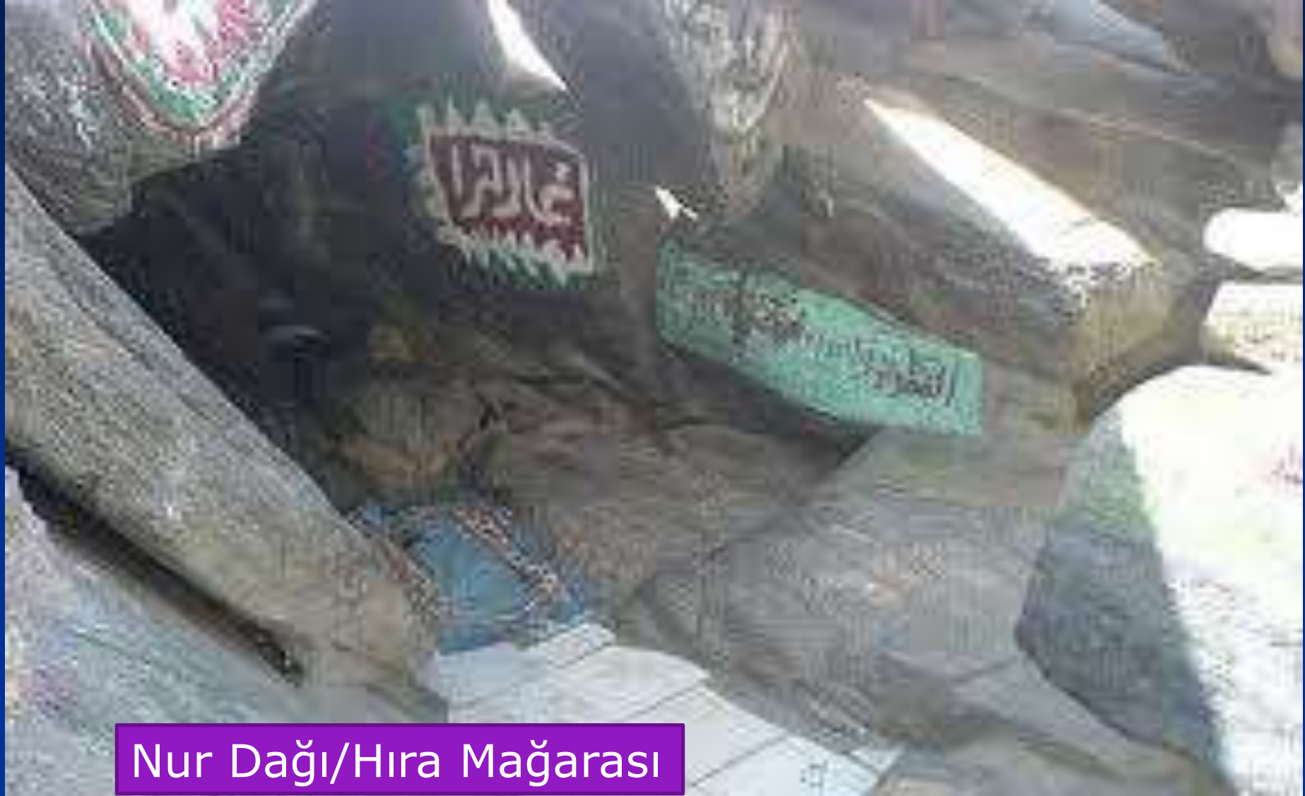
Nur Dağı/Hira Mağarası