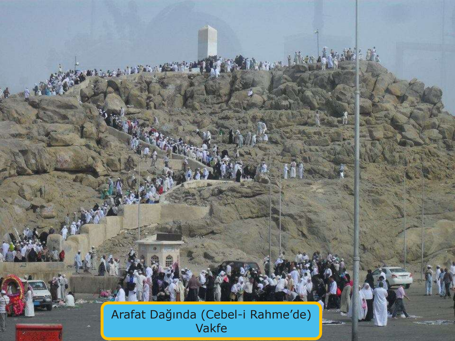
Arafat Dağında (Cebel-i Rahme'de) Vakfe