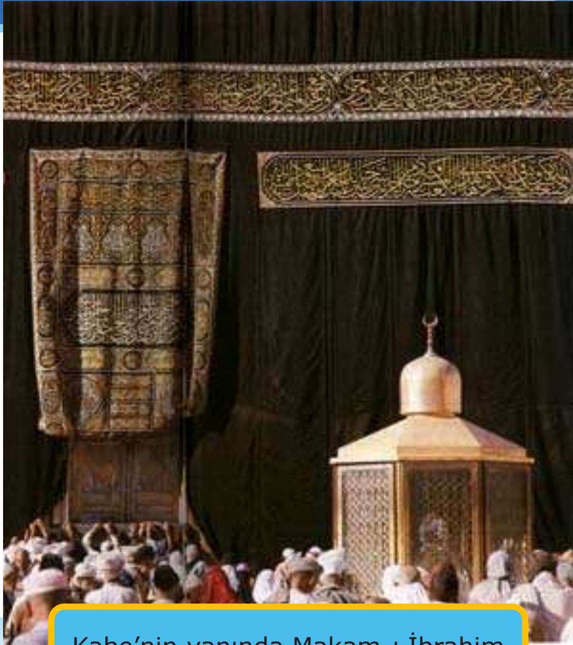
Kabe'nin yanında Makam-ı İbrahim