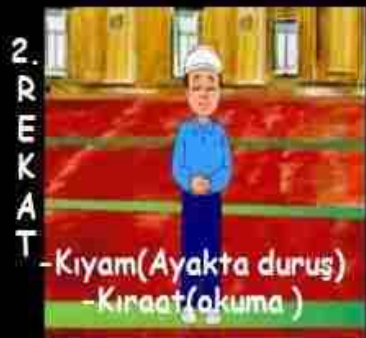
-Kiyam(Ayakta duruş) -Kiraat(okuma)