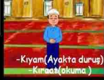
-Kiyam(Ayakta duruş) -Kiraat(okuma)

Sübhanek, Euzu Besmele - Fatiha ve küçük bir sure