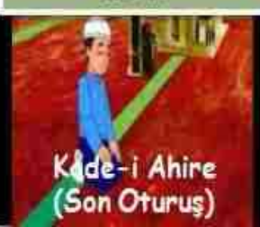
Kade-i Ahire (Son Oturuş)