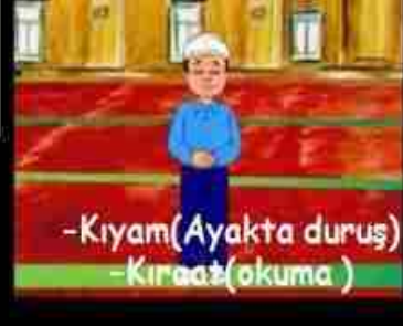
-Kiyam(Ayakta duruş) -Kıraat(okuma)

Sübhanek, Euzu Besmele - Fatiha ve küçük bir sure