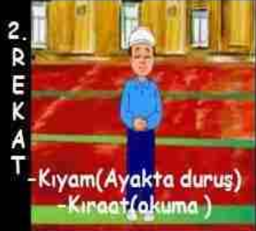
-Kiyam(Ayakta duruş) -Kıraat(okuma)