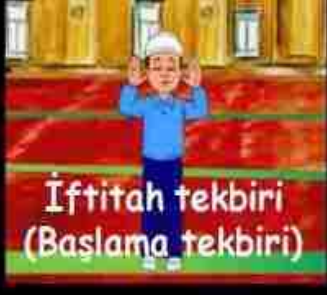
İftitah tekbiiri (Başlama tekbiiri)