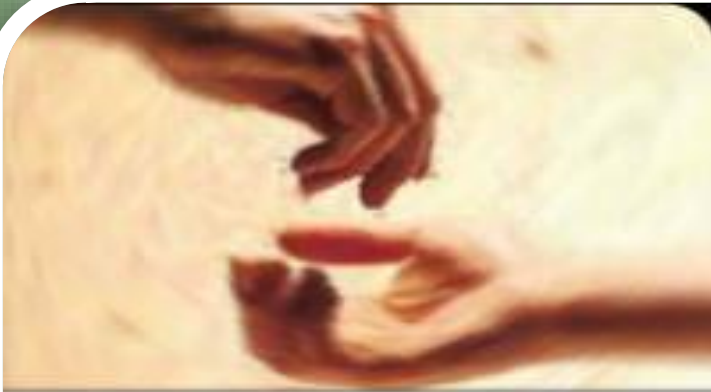
Zekat ve Sadaka

Muhtaç olanlar da toplumumuzun önemli bir kısmını oluştururlar. Bir arada yaşamamanın bir gereği olarak zenginler fakirleri korumalı ve kollamalıdır. İslam dini bunun için zekât ve sadaka gibi ibadetler emretmiş, böylece fakirleri korumuştur