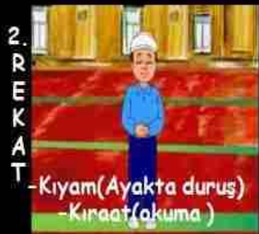
-Kiyam(Ayakta duruş) -Kiraat(okuma)