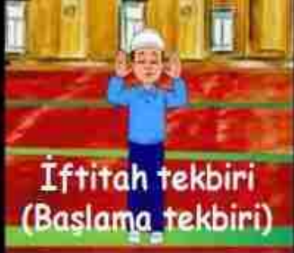
İftitah tekberi (Başlama tekberi)