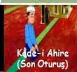
Kade-i Ahire (Son Oturuş)