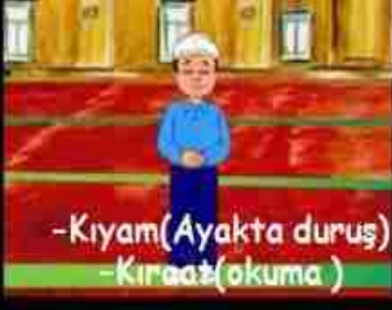
-Kiyam(Ayakta duruş) -Kiraat(okuma)

Sübhanek, Euzu Besmele - Fatiha ve küçük bir sure