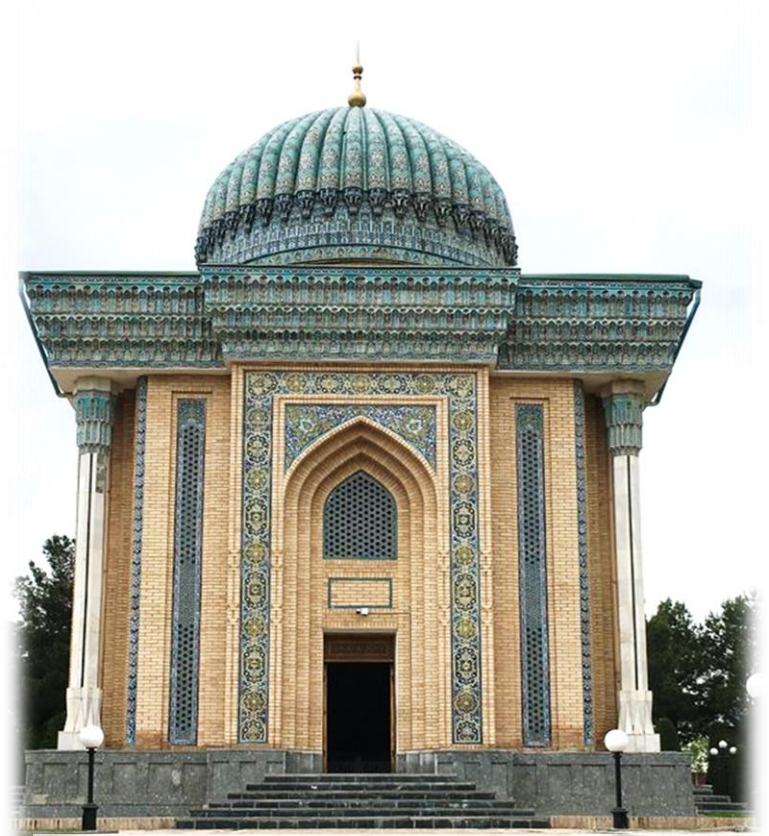
(İmam Maturidi'nin türbesi, Özbekistan)