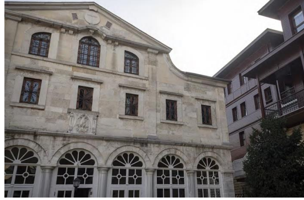
Fener Rum Patrikhanesi