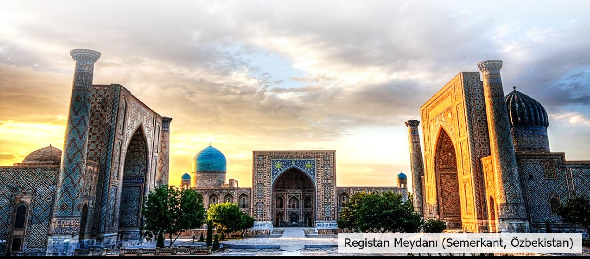
Registan Meydanı (Semerkant, Özbekistan)