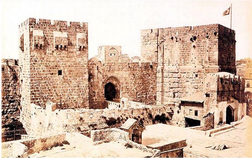
Osmanlı döneminde yapılan Kudüs kalesi