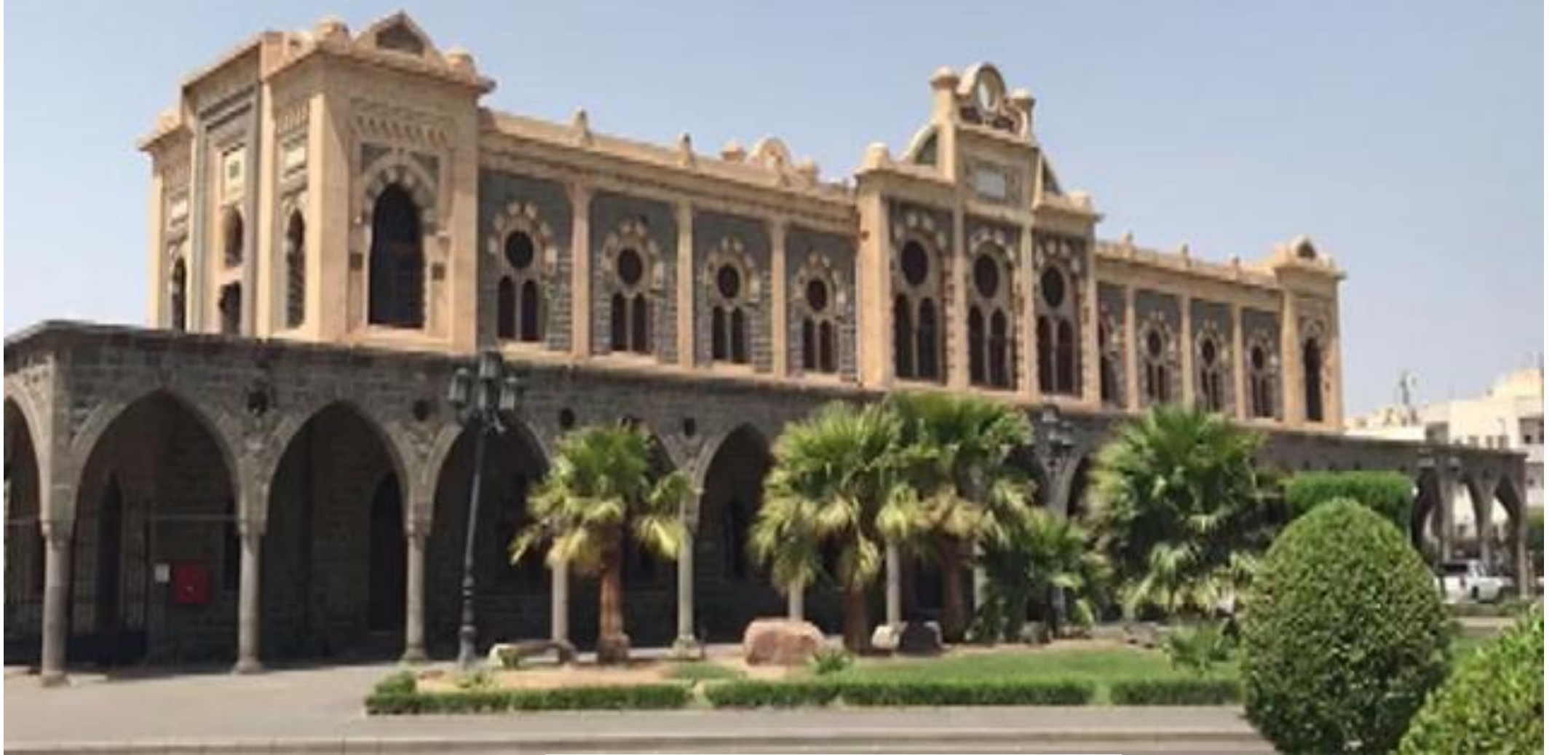
Hicaz Demiryolu Medine İstasyonu