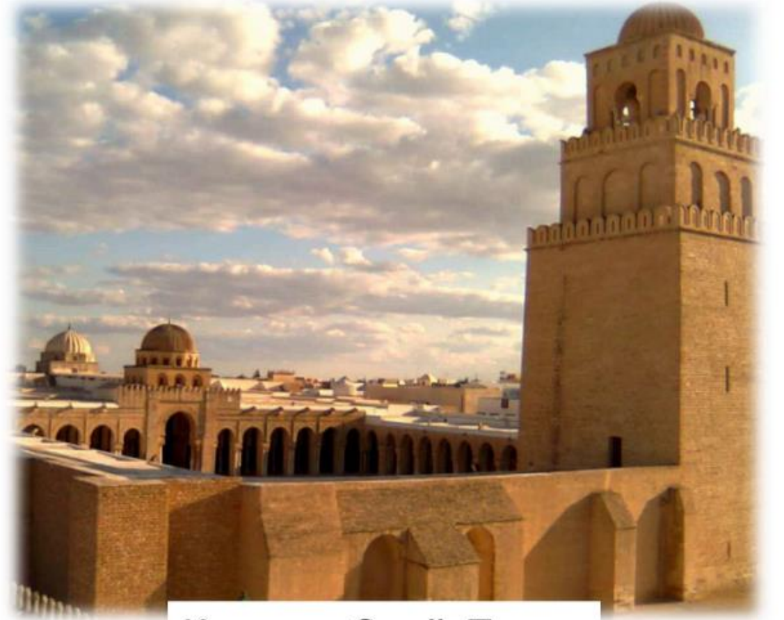
Kayrevan Camii, Tunus