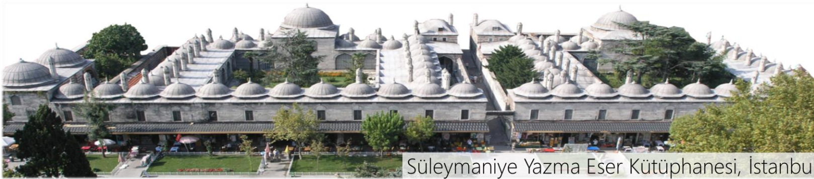
Süleymaniye Yazma Eser Kütüphanesi, İstanbul