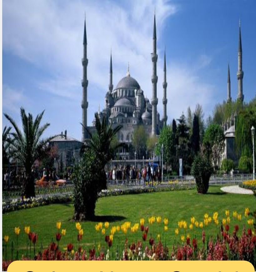
Sultan Ahmet Camisi İstanbul