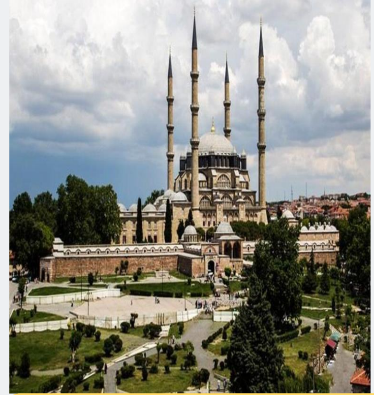
Selimiye Camisi Edirne