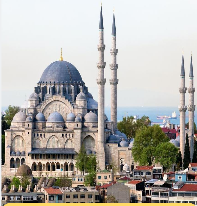
Süleymaniye Camisi İstanbul